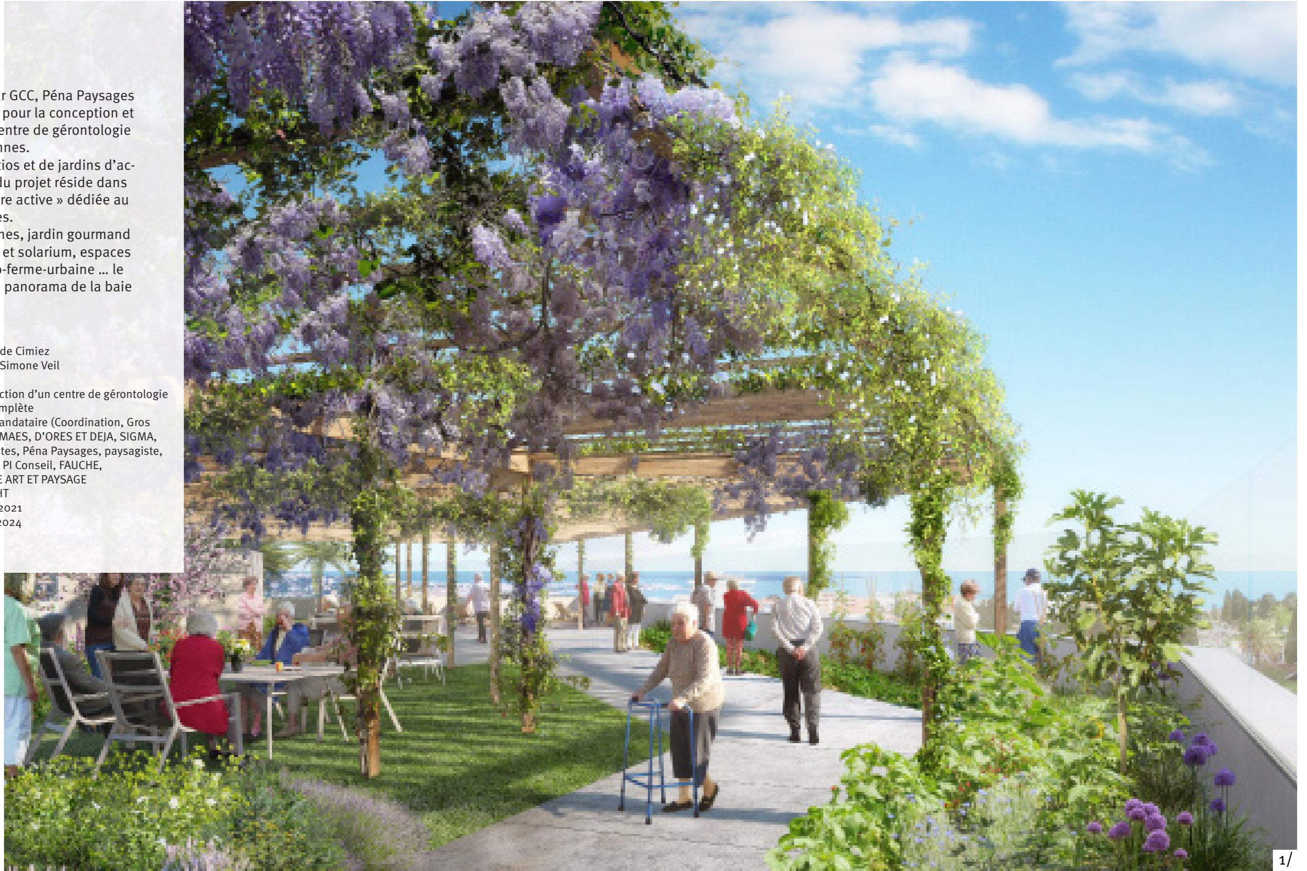
1/ Perspective de la toiture active