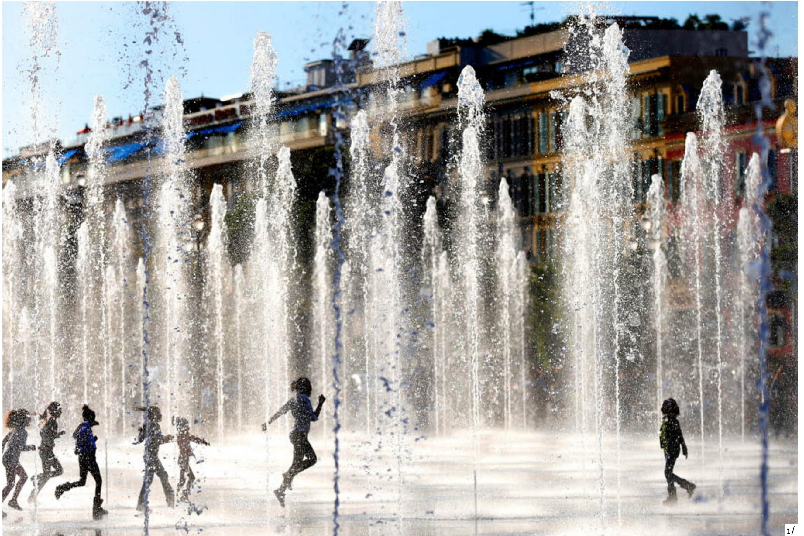
1/ Les jets du miroir d'eau